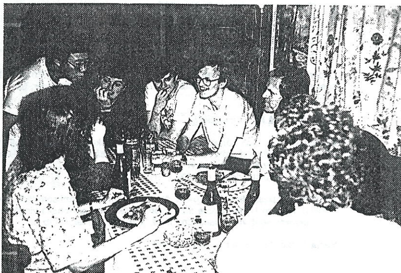
En blandad skara bestående av svenskar engelsmän och vin.